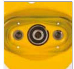
Rodamiento de bola en la tapa del engranaje

Los polipastos y carros Yale no han sido diseñados para aplicaciones de elevación de personas y no deben ser usados con ese propósito.