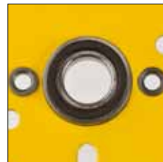
Rodamiento de bola en la placa lateral